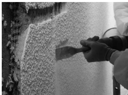
Figura 5.1. Rimozione di intonaco contenente amianto

Nelle Figure 5.1 e 5.2 vengono riportate due differenti tecniche di rimozione: una rimozione pesante mediante l'utilizzo di martello pneumatico per asportare un intonaco contenente amianto e la rimozione di un materiale più difficile da asportare perché più adeso al supporto, la colla per piastrelle; per asportarla si utilizza una levigatrice.