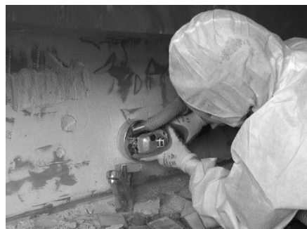
Figura 5.2. Rimozione di colla per piastrelle contenente amianto