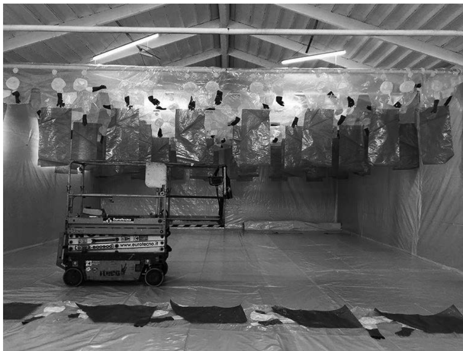
Figura 4.1. Installazione di teli protettivi

quelle aree attraverso le quali possa verificarsi una dispersione non controllata di polvere contenente amianto. Per realizzare la chiusura e il confinamento si utilizzano teli di polietilene di spessore adeguato, applicati con nastro adesivo; i teli vanno applicati sia sulle pareti che sui pavimenti. In genere è sufficiente applicare un solo strato di telo in polietilene sulle pareti verticali, ed un doppio strato di telo orizzontalmente sui pavimenti. Le zone di intersezione tra parete e pavimento dovranno garantire una lunghezza di sovrapposizione tra i due teli di almeno 50 cm. L'installazione dei teli non deve essere in alcun modo interrotta in presenza di elementi che possano comprometterne la continuità come porte, aperture, tubazioni; nel caso è possibile avvalersi di altri strumenti pratici per garantire la continuità del confinamento statico, come utilizzare schiume espanse o prodotti sigillanti come siliconi. È necessario prevedere un'uscita di sicurezza, che garantisca una rapida via di fuga, anch'essa sigillata senza causare discontinuità nel confinamento statico dell'ambiente.